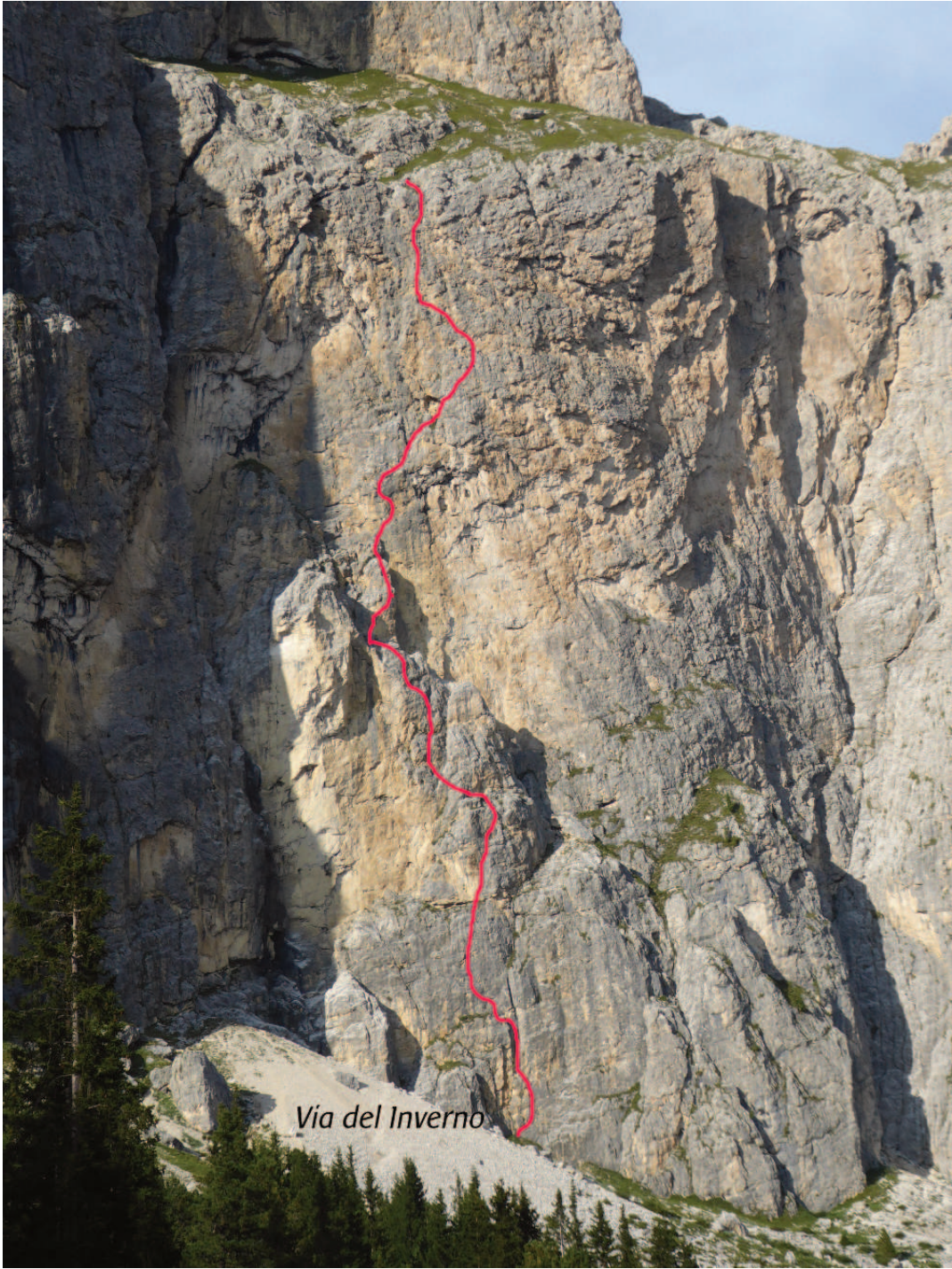
Via del Inverno